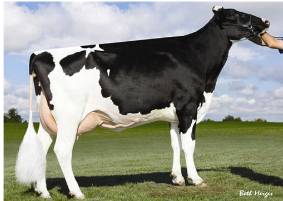
GOLD-N-OAKS GALI1956 Dam